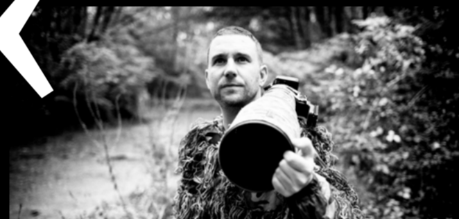
Guillaume PASCHE Photographe animalier