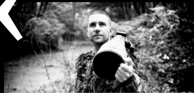
Guillaume PASCHE Photographe animalier